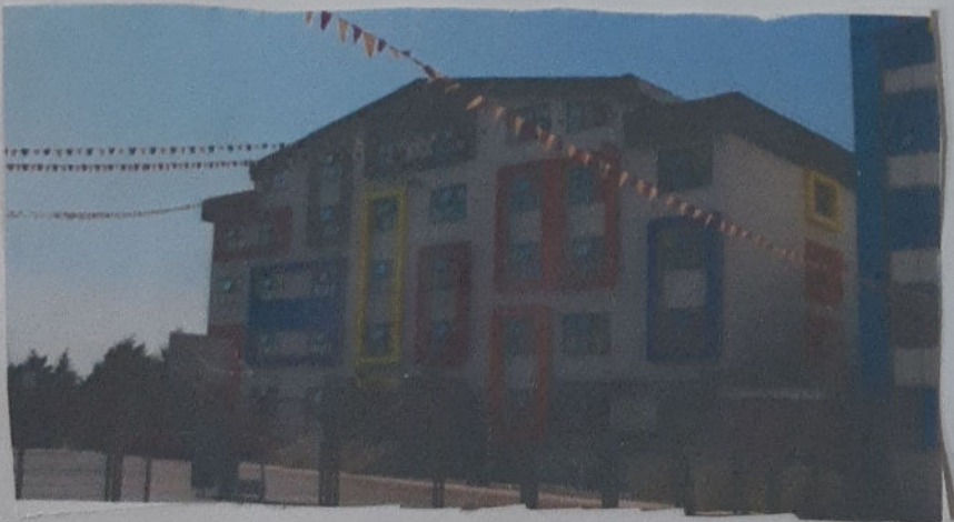
Şehit Kübra Doğanay Kız Anadolu İmamhatip Ortaokulu