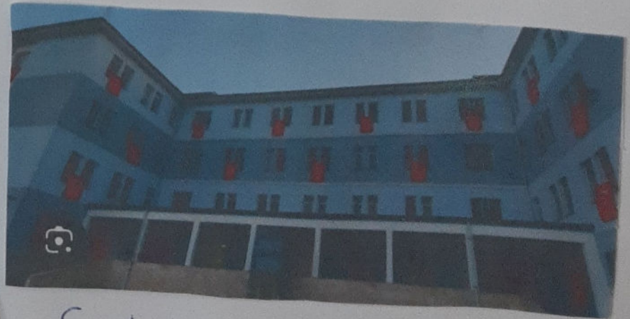
Şehit Kübra Doğanay Kız Anadolu İmamhatip Lisesi